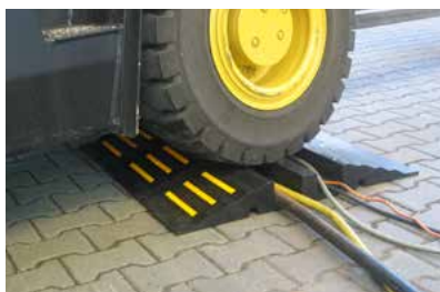
Kabel und Schläuche eingelegt

Schlauch- und Kabelbrücken sind anordnungs- und genehmigungspflichtig und überfahrbar mit minimaler Schrittgeschwindigkeit.