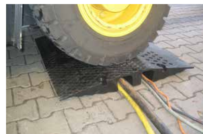
Kabel und Schläuche abgedeckt