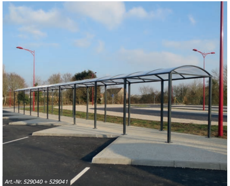
Art.-Nr. 529040 + 529041