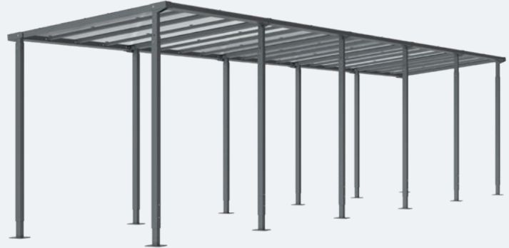
■ Art.-Nr. 529255 + 529256